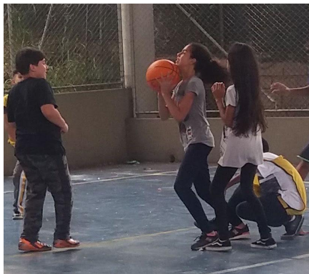
Imagem 9: Crianças jogando basquete. Bola, artefato cultural, prótese contrassexual

Voltando às falas das crianças, o proferimento "as meninas deveriam se dedicar mais para chegar no nosso nível" mostrava a força insistentemente implicada em produzir e garantir a manutenção de determinados significados sobre feminilidade e masculinidade. O jogar "bem" ou não, nos moldes do que aquelas crianças estavam dizendo, funcionavam como próteses que se acoplavam em seus corpos, que produziam determinadas instrumentárias corporais que criavam sujeitos tais e quais narrados. A questão para aqueles corpos-menino não era sensibilizar seus olhos para perceber as potencialidades daqueles corpos-menina, tendo em vista que era na reiteração mesma daquelas frases que eles estavam produzindo uma feminilidade frágil e inábil. O proferimento era o acoplamento mesmo das próteses que os produziam na zona de ranqueamento que os próprios dizeres criavam, ao mesmo tempo que os corpos resistentes a essa lógica implicavam uma força contrassexual para aceder a outras possibilidades. Nesse sentido, a própria bola de basquete nas mãos era uma prótese contrassexual importante, pois era a resposta materializada para uma frase que ecoava tentando produzir determinados tipos de corpos-menina. A força empregada no deslocamento pela quadra era uma prótese importante, pois o próprio deslocar-se no jogo gerava também movimento nos significados ali acoplados.