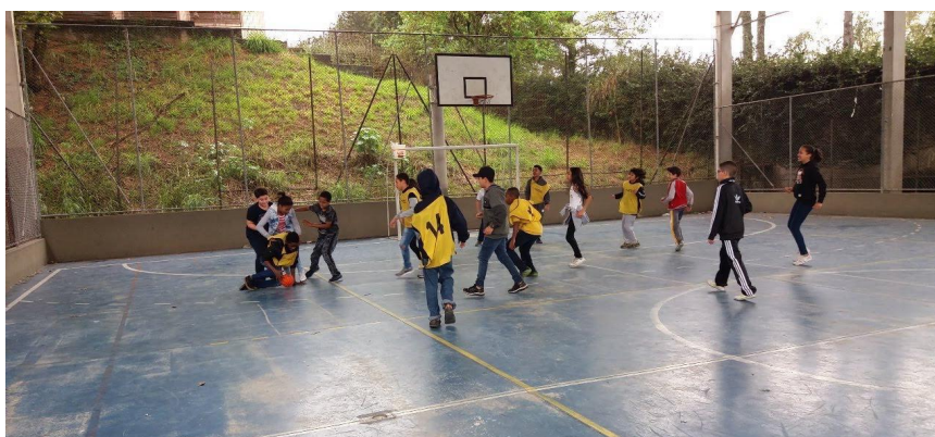
Imagem 10: Corpos em movimento, cena de acoplamento prótético bola-jogo adaptado - disputas